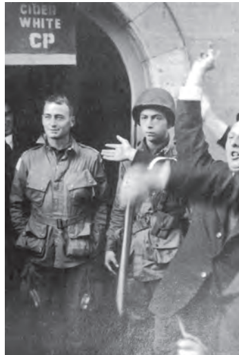
Am 18. September 1944 wird im historischen Rathaus die Kommandozentrale Cider White eingerichtet.