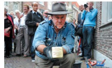
Gunter Demnig zeigt den Stolperstein für Dina.

Stolpersteine sind Gedenktafeln im Bürgersteig vor den Häusern der Leute, die von den Nazis vertrieben, deportiert oder getötet wurden. Steine, über die man mit dem Kopf und dem Herzen stolpert. Um den Text zu lesen muss man eine Verbeugung machen. Stolpersteine sind eine Idee des deutschen Künstlers Gunter Demnig. Er hat in ganz Europa bereits zehntausende verlegt.