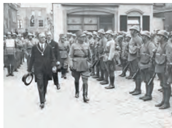
Burgemeester Ficz inspecteert de troepen in 1938 op de Hoofdwagt.