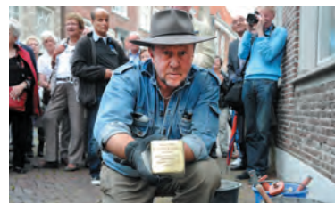
Gunter Demnig toont de Stolperstein voor Dina.

Stolpersteine of 'struikelstenen' zijn gedenktekens op het trottoir voor de huizen van mensen die door de nazi's verdreven, gedeporteerd of vermoord zijn. Stenen waarover je 'struikelt met je hoofd en je hart en waarbij je moet buigen om de tekst te kunnen lezen'. Stolpersteine zijn een idee van de Duitse kunstenaar Gunter Demnig. Hij heeft er in heel Europa al tienduizenden gelegd.