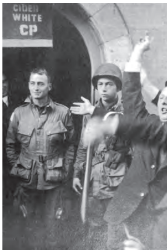
18 september 1944 wordt in het historisch stadhuis commandopost Cider White gevestigd.